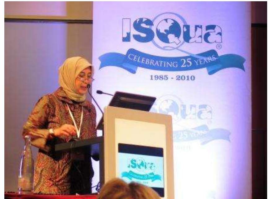
ISQua's Conference, 2012, Paris