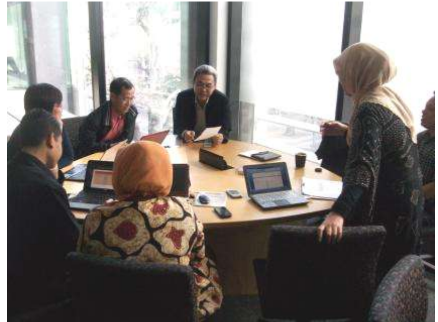
Diskusi Akreditasi RS, Melbourne, 2012