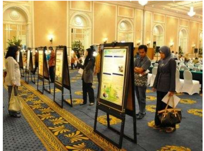
Forum Mutu 2010, Jakarta