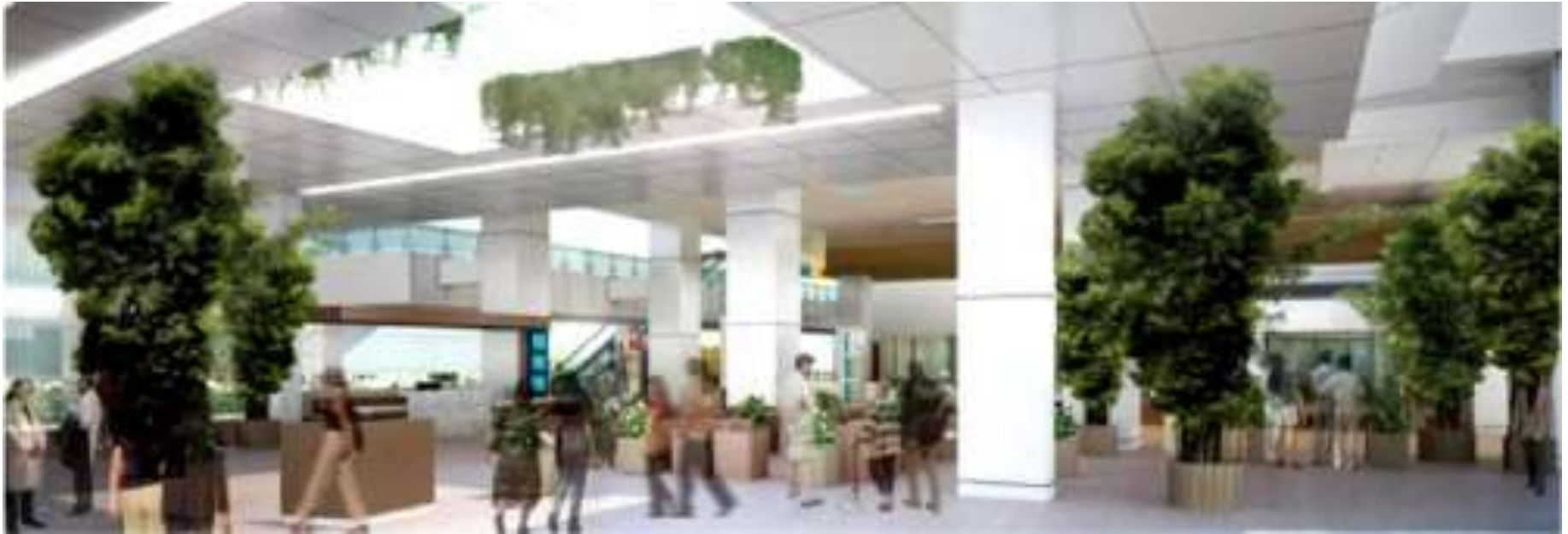
Green Space di RS Khoo Teck Puat, Singapura