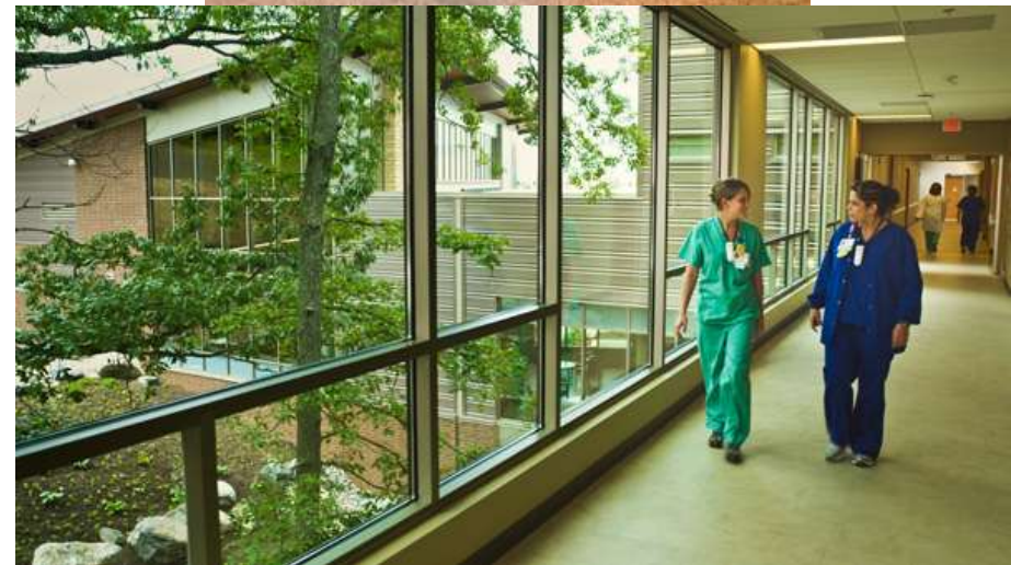
RS Franklin Woods di Johnson City, Tennessee, Amerika Serikat