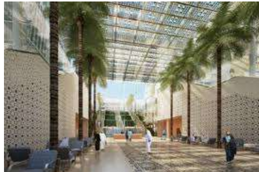
Herlev Hospital, Denmark