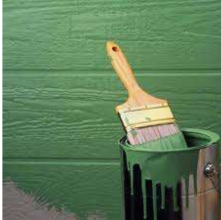
Cat yang rendah VOC