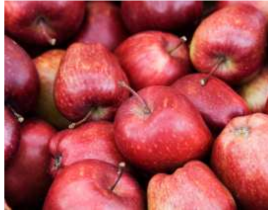
Bahan Makanan dari Pertanian Organik