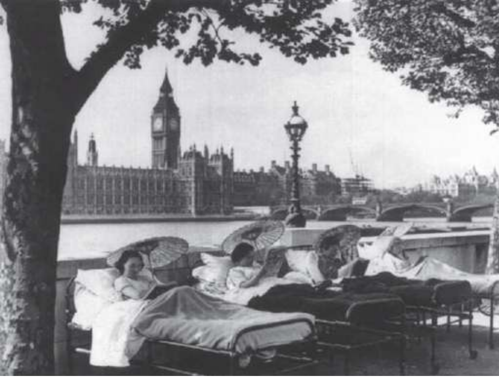
RS St Thomas di tepi Sungai Thames tahun 1948, dirancang untuk pasien yang membutuhkan “verandah treatment”, cukup sering diberikan sampai tahun 1960an